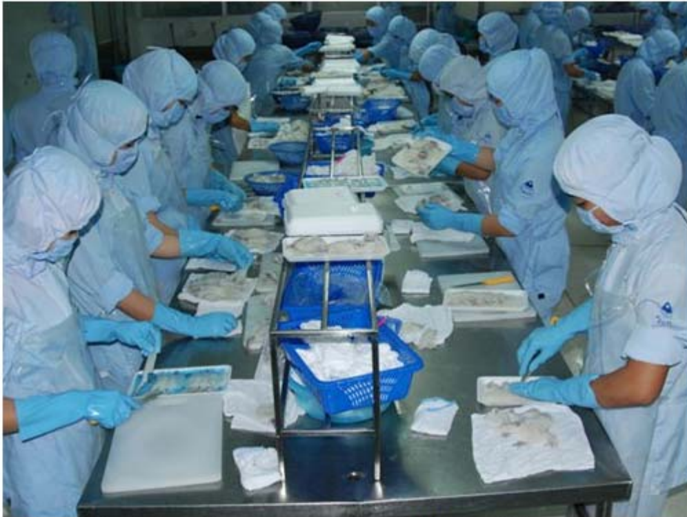
Tốc độ tăng trưởng năng suất lao động của Việt Nam có dấu hiệu giảm dần