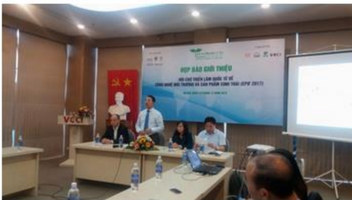
Họp báo về Hội chợ Quốc tế Công nghệ và sản phẩm xanh. (Ảnh: Lương Liễu).

Chương trình diễn ra trong 3 ngày từ 11-13/05/2017 tại Trung tâm Hội chợ triển lãm Sài Gòn - SECC (số 799 Nguyễn Văn Linh, quận 7, TP Hồ Chí Minh).