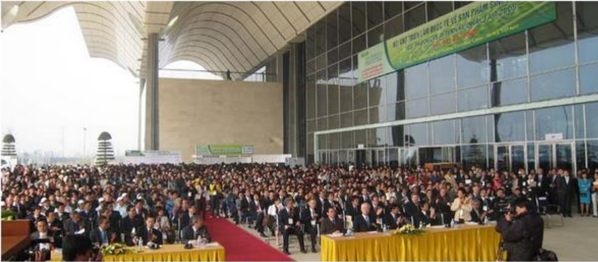
Khai mạc Hội chợ triển lãm quốc tế về sản phẩm sinh thái - EPIF 2008

Hội chợ triển lãm về sản phẩm sinh thái (EPIF) được APO khởi xướng từ năm 2004 và được tổ chức hàng năm tại các nước thành viên APO nhằm tuyên truyền, nâng cao nhận thức của người tiêu dùng và cộng đồng về năng suất và phát triển bền vững thông qua sản xuất và tiêu thụ các sản phẩm thân thiện với môi trường.