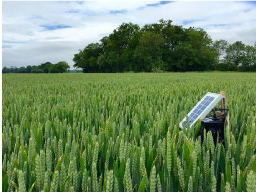
Theo TS Santhi: Công nghệ sẽ thay đổi cách thức làm nông nghiệp

"Đây là một xu hướng mới vì trước đây APO có thực hiện khá nhiều dự án về nghiên cứu đổi mới sáng tạo trong nông nghiệp như các nhà máy sản xuất rau sử dụng công nghệ cao trong diện tích nhỏ để trồng rau quanh năm", ông nói.