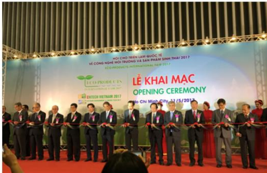
Lễ cắt băng khánh thành Hội chợ Triển lãm