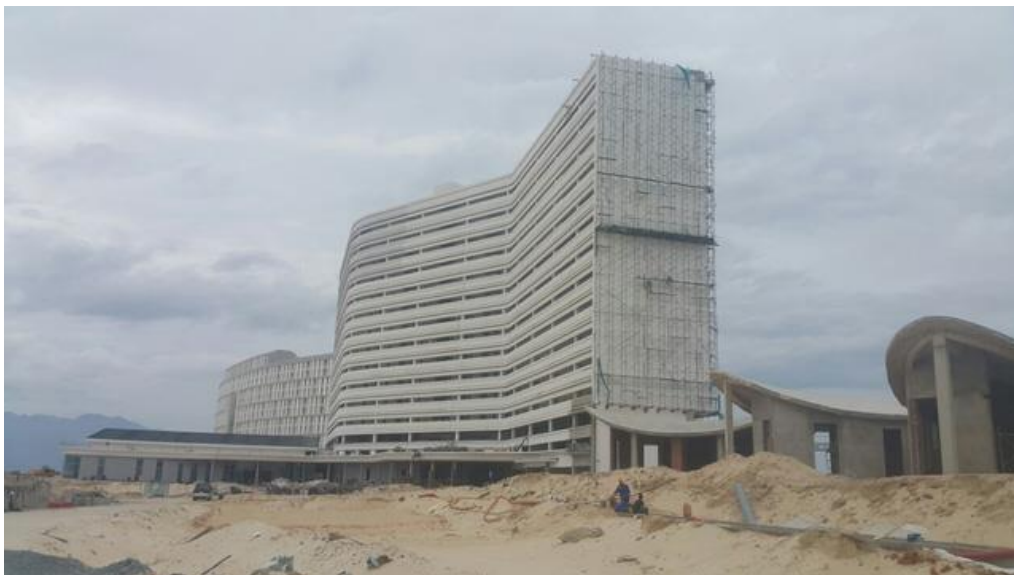
Năng suất lao động trong ngành bất động sản tại Việt Nam đang đứng top 4 châu Á

Viện Nghiên cứu Kinh tế và Chính sách (VEPR) vừa đưa ra số liệu của điều tra năng suất lao động Việt Nam dựa trên con số của Tổ chức Năng suất châu Á (APO). Theo đó, VEPR khẳng định: Tốc độ tăng trưởng bình quân năng suất lao động giai đoạn 2012-2017 đạt 5,3% một năm. Cao nhất vào năm 2015 với tốc độ 6,49%.